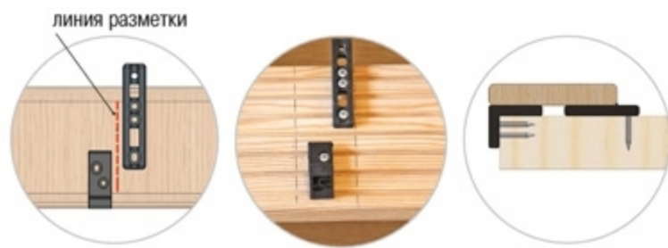
Вариант 1 – ТОРЦЕВОЕ крепление стартового крепежа

3 Монтаж первой доски. Выбираем наиболее удобный вариант крепления (торцевой или боковой) первой доски. Крепим шурупами №1 на первую доску стартовый ДУЭТ и один элемент крепежа ДУЭТ 90. Через монтажные отверстия стартового ДУЭТа и ДУЭТа 90 шурупами №2 крепим первую доску к лагам террасы.