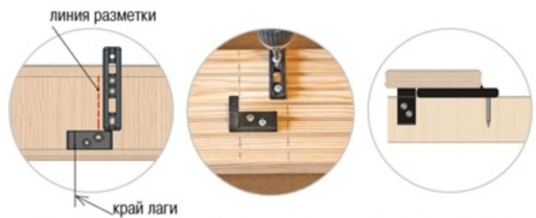
Вариант 2 – БОКОВОЕ крепление стартового крепежа

4 Монтаж рядовых досок на лаги. Устанавливаем палубную доску с закрепленным крепежом ДУЭТ 90 на основание террасы. Для формирования монтажных зазоров используем сборку А-спейсеров. Через монтажные отверстия крепежа крепим палубную доску к лагам шурупами №2. Крепим необходимое количество палубных досок. А-спейсеры перемещаем только после крепления 3-4-х рядов. Свободный край последней доски фиксируем наиболее удобным способом.